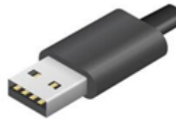
USB typ A